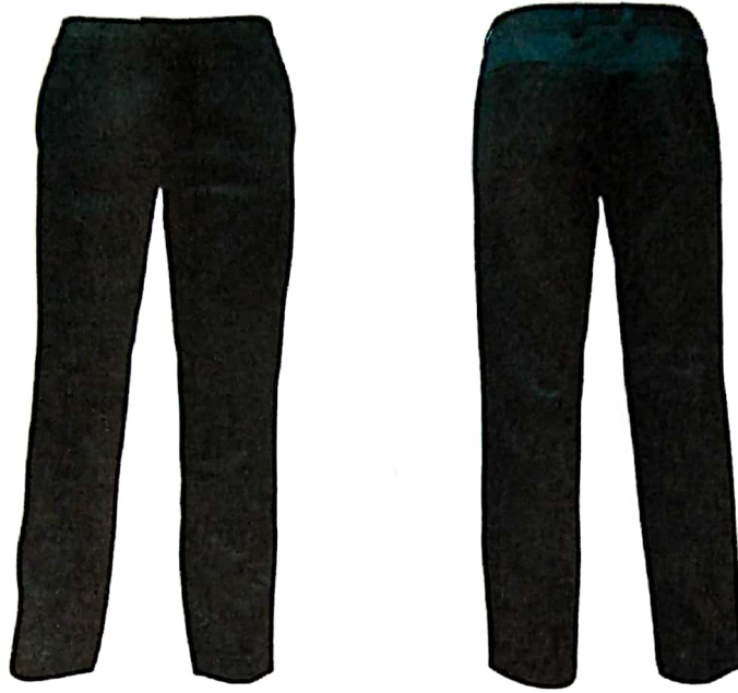
กางเกงทรงสลีคขายาวสีเข้ม